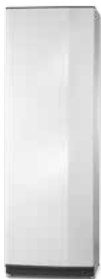
NIBE VPB S300