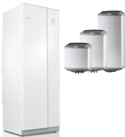
HAATO HK SC ja HK 35, 55 ja 100 l.