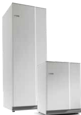
NIBE Compact 300 l ja 100 l

NIBE on valmistanut lämminvesivaraajia yli 70 vuoden ajan ja tarjoamme lämminvesivaraajia kaikkiin lämmitysjärjestelmiin ja kaikkiin taloihin. Useimmille vesilaaduille ruostumaton teräs on hyvä valinta, mutta jos oman kaivon veden pH-arvo on alhainen tai jos vesi on suolapitoista, voi emalisäiliö olla parempi vaihtoehto.